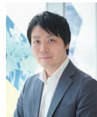
東洋美術印刷株式会社 デジタルマーケティング推進部 プロダクションマネージャー