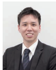
ハートコア株式会社 CX営業部